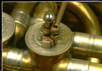
BRASSWERKSTATT REPARATUR SCHUBSTANGE