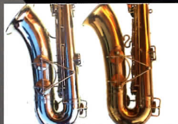
SAX HISTORY HENRI SELMER & SELMER USA