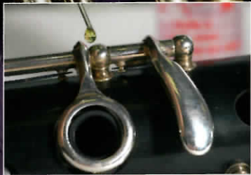
SAX DOCTOR ÖLEN LEICHT GEMACHT